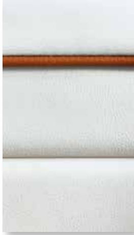
1 White Cream Ocean