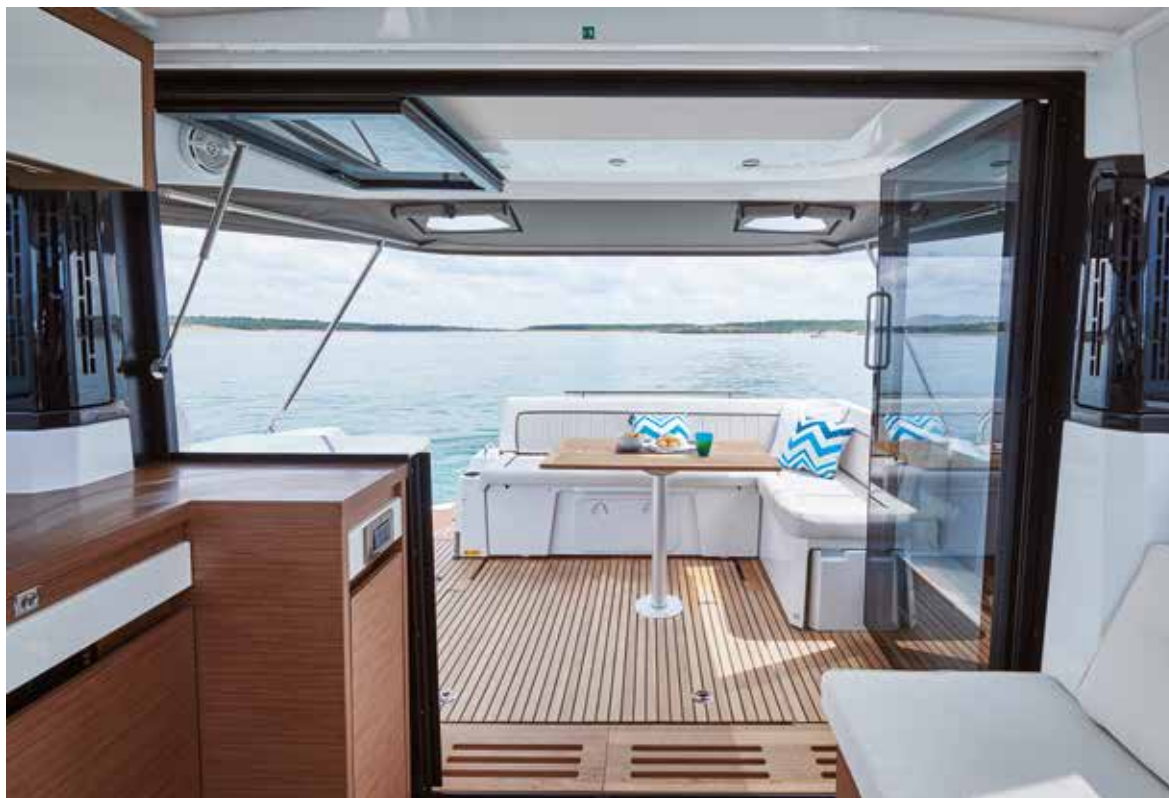
Walnut interior woodworks standard / Intérieur Noyer Fil en standard

EN | With her L-shaped, modular aft cockpit that transforms into a sundeck, the NC 37 offers absolute comfort on board, perfect for families. You will love the attractive innovation on this model: an immense sliding glass door fully opens onto the aft cockpit! The NC 37 offers a vast indoor-outdoor living space between the spacious interior saloon, the central galley and the large cockpit. FR | Grâce au cockpit arrière en L, modulable et adaptable en bain de soleil, le NC 37 offre un confort absolu pour une vie à bord très agréable, parfaite en famille. Vous allez apprécier la belle innovation de ce modèle: l'immense baie vitrée s'ouvre complètement sur le cockpit arrière ! Le NC 37 propose ainsi un vaste espace de vie entre le grand salon intérieur, la cuisine centrale et le large cockpit extérieur.