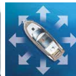
Available with joystick / Disponible avec joystick