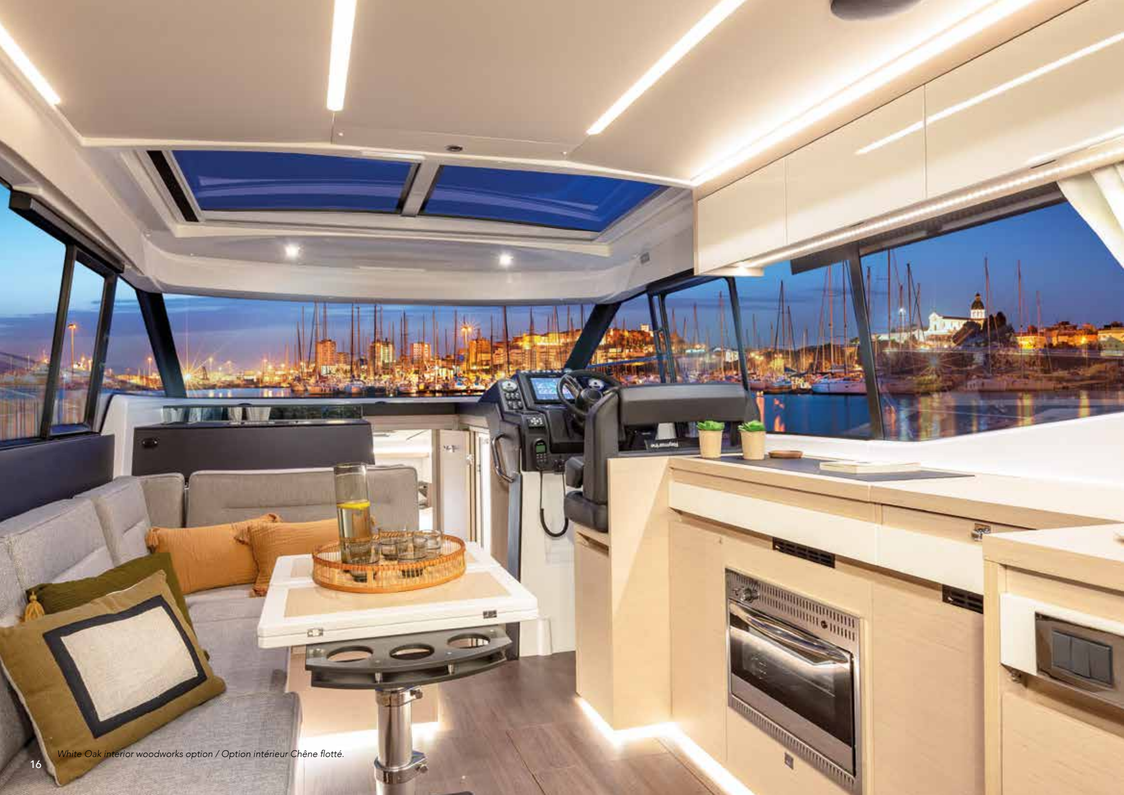
White Oak interior woodworks option / Option intérieur Chêne flotté.